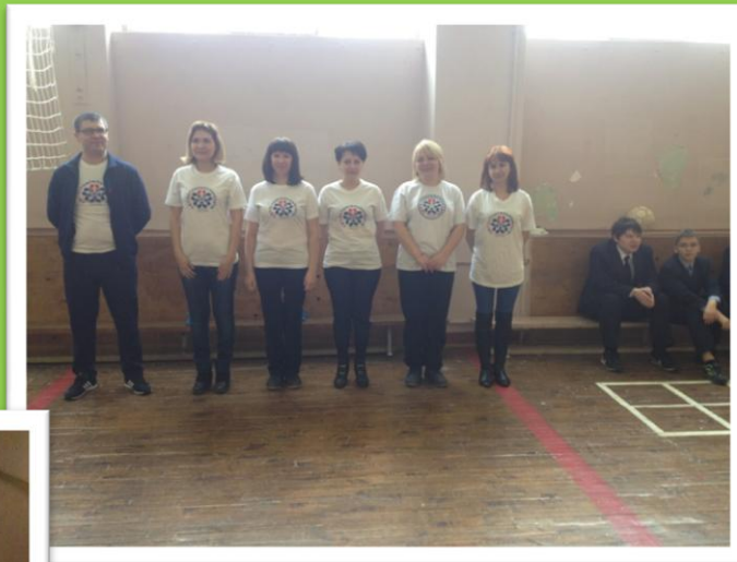
Акция « Будь готов! Скажи нет!»