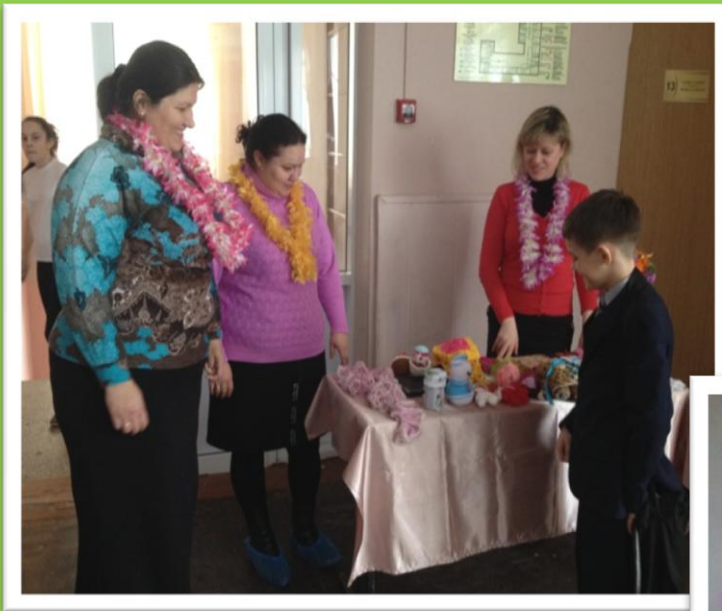
Благотворительная ярмарка акция «Зимушка зима»